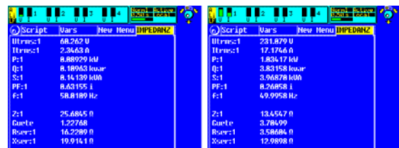
Bild 4: Anwenderdefiniertes Impedanz-Menü des Leistungsmessgerätes LMG500

Führt man die Messung mit einer ausreichenden Anzahl von Betriebspunkten durch, so können auch die Zwischenwerte interpoliert werden. Damit ist der gesamte nichtlineare Verlauf der Großsignal-Impedanz im Betriebsbereich bestimmt.